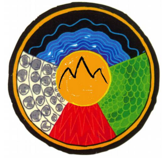
Medizinrad der Dagara

Die Faszination aller Formen von Aufstellungsarbeit liegt in ihrer emotionalen Wirkung auf die Beteiligten und im Schöpfen aus einem unbekanntem Wissen im Raum der Aufstellung. Auftauchen von Gefühlen und