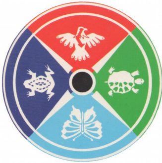
Medizinrad Bear tribe (Sun Bear)