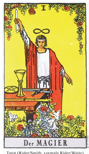
Tarot (Rider/Smith, vormals Rider/Waite)